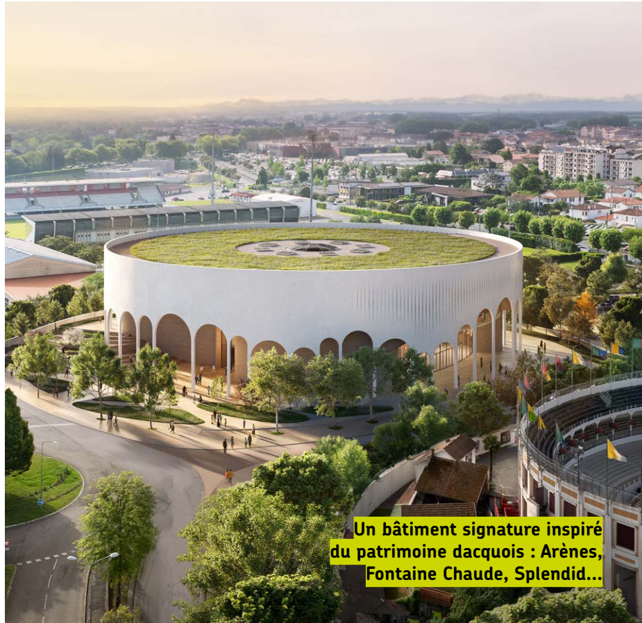
Un bâtiment signature inspiré du patrimoine dacquois : Arènes, Fontaine Chaude, Splendid...

Aujourd'hui, les plans sont finalisés : les marchés de travaux peuvent être lancés dès cette année pour une ouverture en 2029.